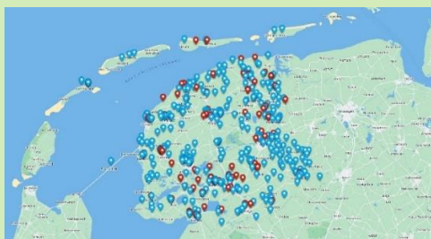
Kaart controlelocaties Digitale Checklist

Bij de opslag van gevaarlijke stoffen gaat het vaak om de WBDBO van de opslagruimte en het volledig ontbreken van een opslagvoorziening. Dergelijke inzichten leveren een bijdrage aan het (beter invullen) van risicogericht toezicht en zijn mogelijk door het gebruik van de Digitale Checklisten.